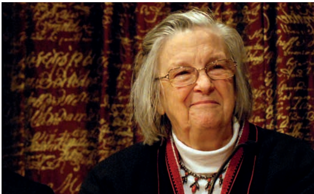
Ostrom tijdens de uitreiking Nobelprijs voor de economische wetenschappen, 2009