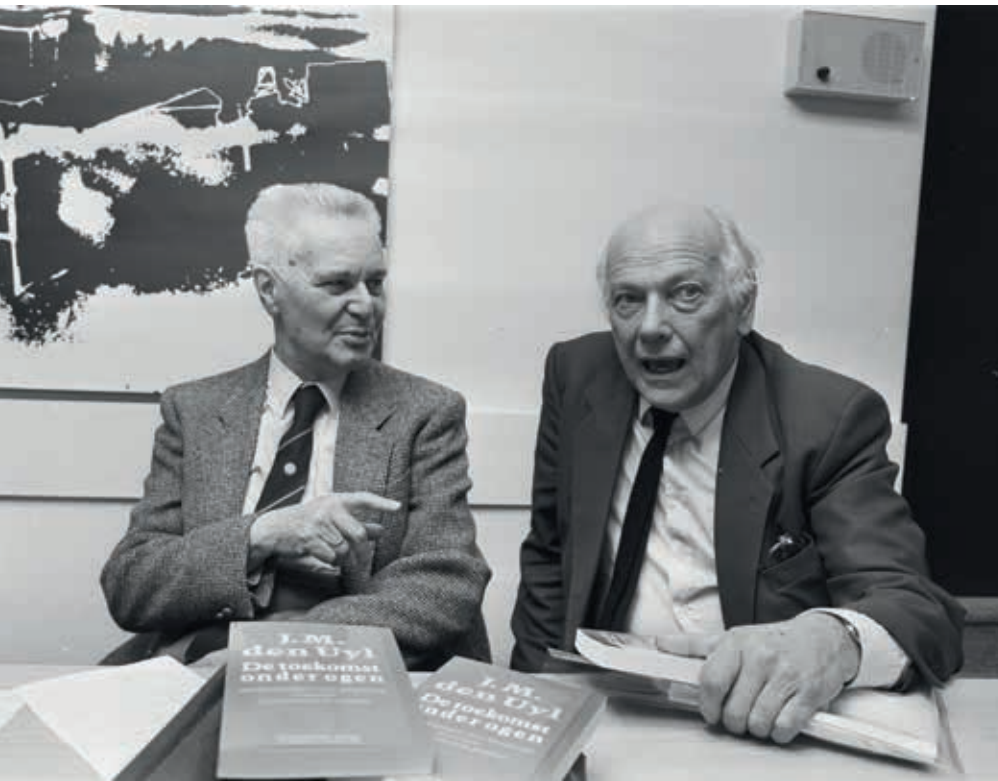
Foto: Jan Tinbergen en Joop den Uyl (rechts) bij boekpresentatie