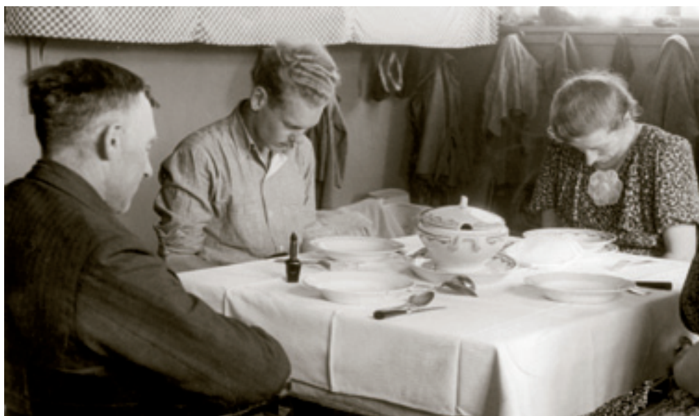
Bidden voor de maaltijd, Wieringermeer 1940.