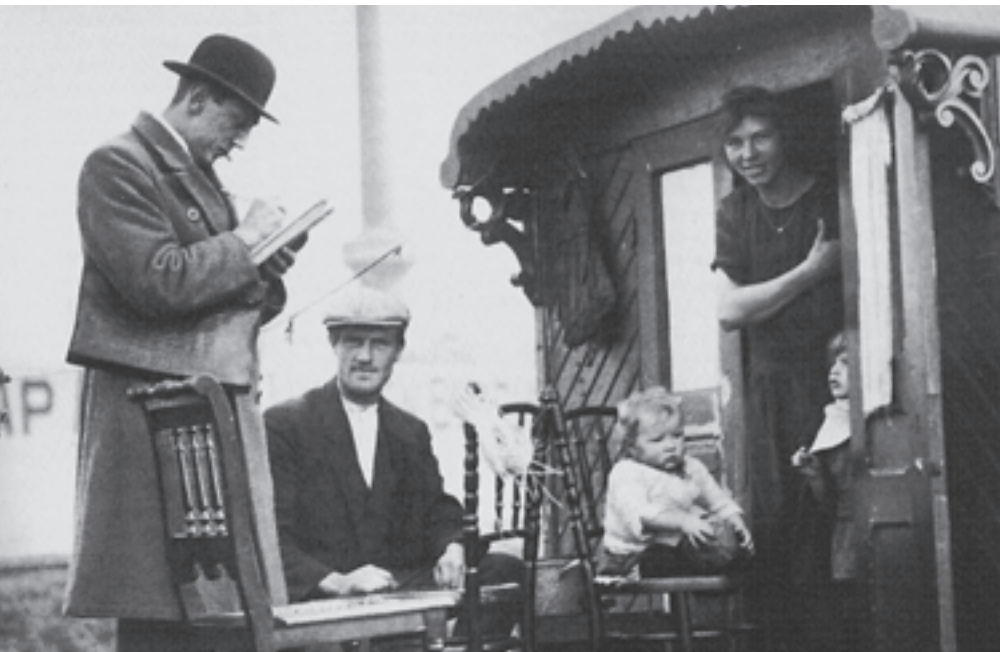
Volkstelling 1925; ambtenaar bezoekt zigeunerfamilie.

In veel landen wordt, meestal eens in de tien jaar, de bevolking geteld, zodat de behoefte aan allerlei (lokale) voorzieningen kan worden vastgesteld. Volkstellingen zijn echter kostbaar en steeds vaker aarzelen of weigeren mensen om mee te werken. In Nederland bijvoorbeeld wordt al sinds 1971 geen volkstelling meer gehouden. Om toch aan de benodigde informatie te komen zijn daarom nieuwe telmethoden ontwikkeld, waarbij bestaande databronnen worden ingezet. Dit artikel geeft een overzicht van de alternatieven die anno 2010 in Europa worden gebruikt.