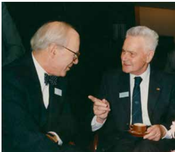
Jan Tinbergen (rechts) in gesprek met Lawrence Klein (links) bij de viering van het 125-jarig bestaan van de KVS in 1987

vraagstukken. Dit laatste onderwerp was het in de periode 1993–2015 het meest bestudeerde onderwerp van advies. De aandacht voor de snelle veranderingen in de structuur van markten in Nederland is tevens een goede graadmeter van de verschuiving van aandacht van economen in die tijd waarbij het kabinetsbeleid DMW (Deregulering, Marktwerving en Wetgevingskwaliteit) ongetwijfeld een grote rol heeft gespeeld.