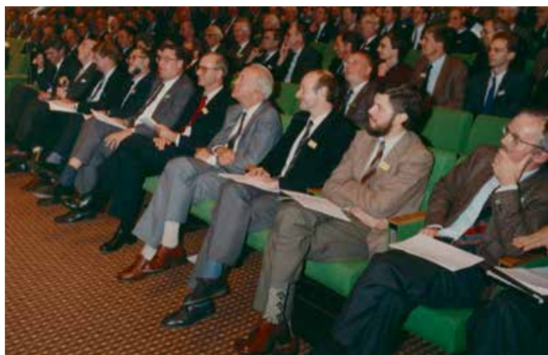
Publiek bij de viering van het 125-jarig bestaan van de KVS in het Congresgebouw Den Haag, 24 oktober 1987

Wie de integrale verslagen terugleest, krijgt de indruk dat dit lange zittingen geweest moeten zijn. Vooraanstaan-