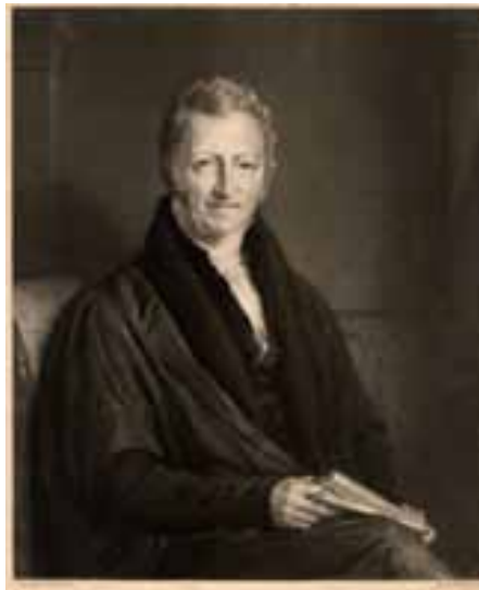
Thomas Robert Malthus 1766 – 1834

De centrale stelling in het werk van Malthus is dat de draagkracht van de aarde in termen van voedselvoorziening de groei van de bevolking niet zou kunnen bijhouden. Tenminste, als mensen zich als konijnen ongehinderd zouden vermenigvuldigen. In de praktijk zijn er echter wel remmende factoren en de groei van de bevolking wordt volgens Malthus beteugeld door 'misery and vice': ellende als hongersnood, oorlog en ziektes en ondeugden als abortus en het gebruik van voorbehoedmiddelen. Dat was een harde en weinig bemoeidigende boodschap. Malthus verbond aan zijn bevolkingstheorie ook een boodschap voor beleidsmakers door kritiek te uiten op het gedecentraliseerde stelsel van sociale zekerheid van zijn tijd: de Poor