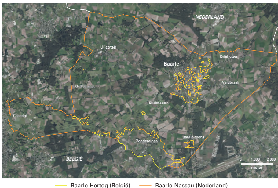
Figuur 1. Grenzen van de gemeenten Baarle-Hertog (België) en Baarle-Nassau (Nederland)

Bronnen: OpenStreetMap / PDOK-achtergrond luchtfoto.