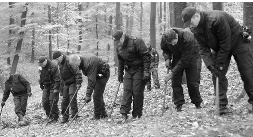
Op zoek naar het moordwapen.